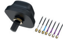
Dachantenne Teltonika PR1KC640