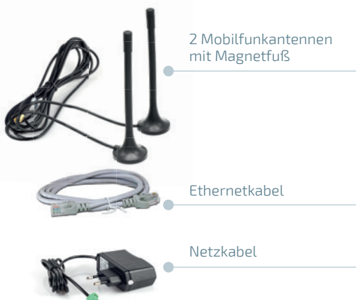
2 Mobilfunkantennen mit Magnetfuß